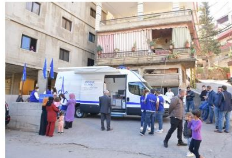
عيادة أجيالنا المتنقلة