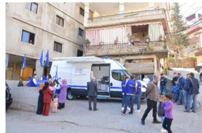
كثبت أسماء لنبور في الثلاثاء 26 أكتوبر 2021 الساعة 07:23 مساءً - منذ ساعتين

إشتر في Facebook | إشتر في Twitter | 0 نشر | مرر | 0 | 0 | 0 | 0