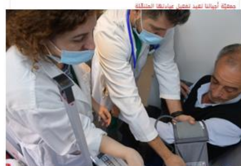
جمعية أجيالنا لغيرنا تفعل: عيادتها الخيرية